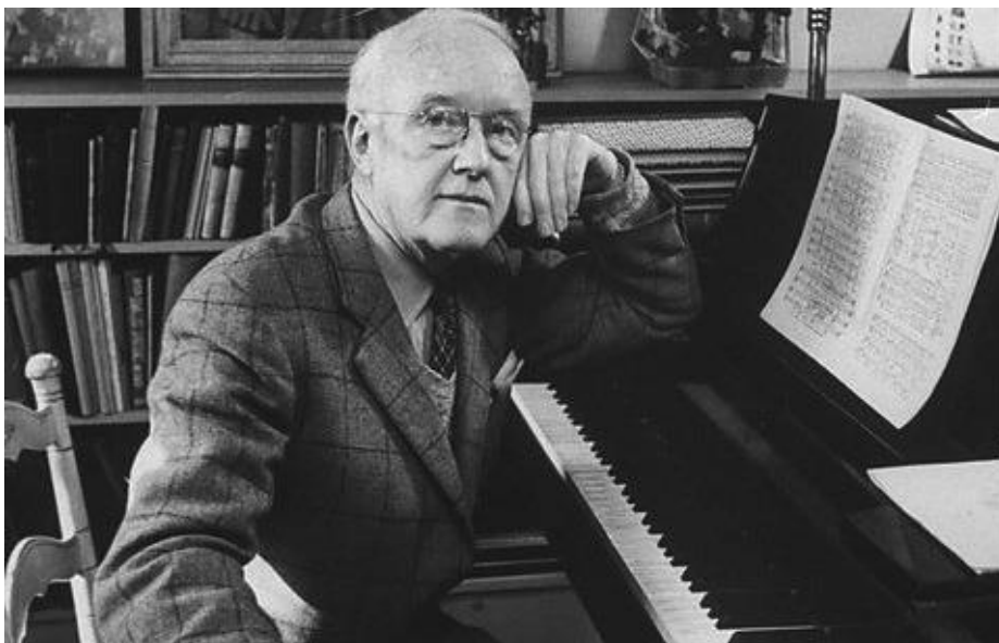
3 Randall Thompson

Frostiana (Randall Thompson) is in feite een verzameling Engelse volksliederen. Ook wel bekend onder de naam Seven Countrysongs . Hij componeerde het in 1959 in opdracht van de stad Amherst in Massachusetts waarmee de stad zijn 200 jarig bestaan wilde vieren. De naam Frostiana is dan weer een ode aan de Amerikaanse dichter Robert Frost (1874-1963) die het traditionele leven in New England vaak gebruikte als inspiratiebron voor zijn werken, en die enkele jaren in Amherst heeft gewoond.. Frostiana is op en top een werk dat staat in de traditie van Engelse koor- en samenzang. Overigens was Robert Frost aanwezig bij de première in Amherst op 18 oktober 1959 en hij was zo enthousiast over de compositie van zijn gedichten dat hij een staande ovatie gaf en Thompson die het polatselijke koor dirigeerde toeriep 'sing it again', hij was zelfs zo onder de indruk dat hij onmiddellijk een verbod uitvaardigde waarin hij vastlegde dat hij andere componisten geen toestemming gaf zijn gedichten op muziek te zetten.