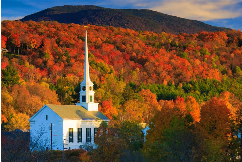
2 Amherst, Massachusetts

Frostiana (Randall Thompson) is in feite een verzameling Engelse volksliederen. Ook wel bekend onder de naam Seven Countrysongs . Hij componeerde het in 1959 in opdracht van de stad Amherst in Massachusetts waarmee de stad zijn 200 jarig bestaan wilde vieren. De naam Frostiana is dan weer een ode aan de Amerikaanse dichter Robert Frost (1874-1963) die het traditionele leven in New England vaak gebruikte als inspiratiebron voor zijn werken, en die enkele jaren in Amherst heeft gewoond.. Frostiana is op en top een werk dat staat in de traditie van Engelse koor- en samenzang. Overigens was Robert Frost aanwezig bij de première in Amherst op 18 oktober 1959 en hij was zo enthousiast over de compositie van zijn gedichten dat hij een staande ovatie gaf en Thompson die het polatselijke koor dirigeerde toeriep 'sing it again', hij was zelfs zo onder de indruk dat hij onmiddellijk een verbod uitvaardigde waarin hij vastlegde dat hij andere componisten geen toestemming gaf zijn gedichten op muziek te zetten.