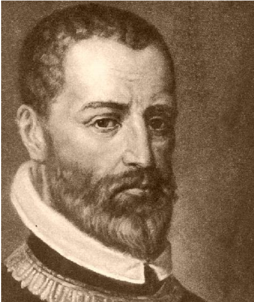
77 Giovanni Pierluigi da Palestrina (1525-1594)

opstanding. Improperia is al eerder door het GVE met veel toewijding gezongen, voor een deel van de zangers zal het nieuw zijn, maar het werk betovert iedereen door zijn eenvoudige, harmonieuze en meditatieve karakter. Zie: https://www.youtube.com/watch?v=hpaHtdK7E7o