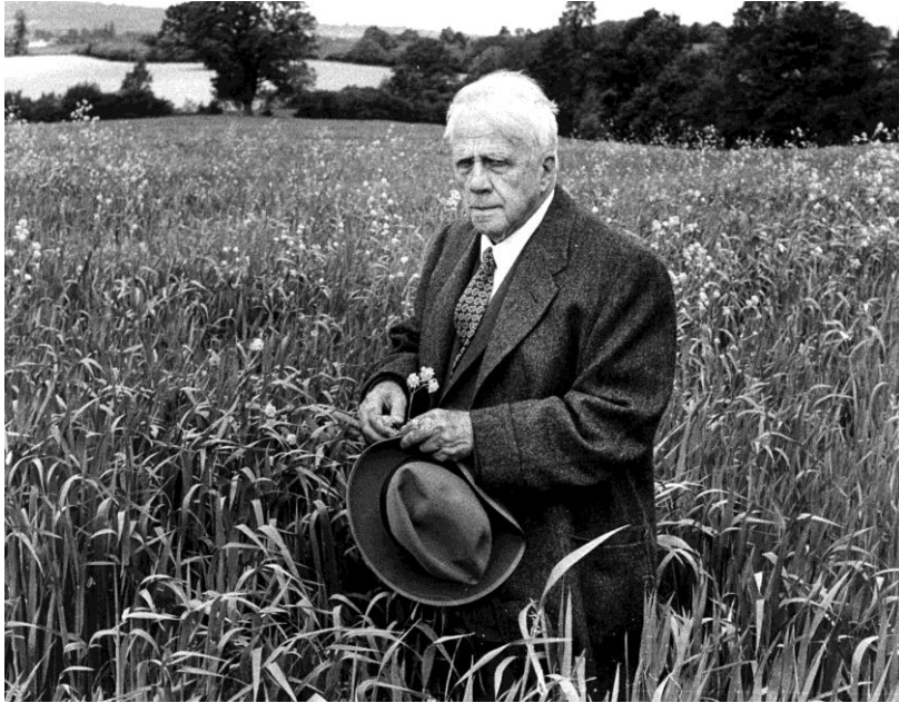
4 Robert Frost

Zie: https://www.youtube.com/watch?v=qgotLc73va0